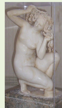
Venere Rodia / Museo Archeologico di Rodi